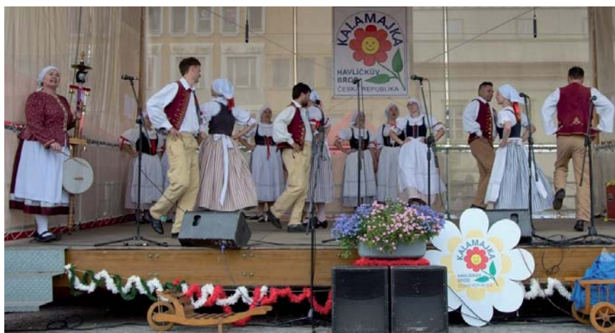
Festival Havlíčkův Brod