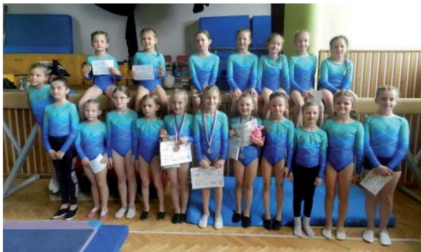
Domácí závody I. Domácí závody II. Listopadové soustředění

Závěrem chceme poděkovat všem, kteří nás podporují, zejména Základní škole T. G. Masaryka, obci Příbyslavice, firmě Mann Hummel, cestovní kanceláři Tipatour.