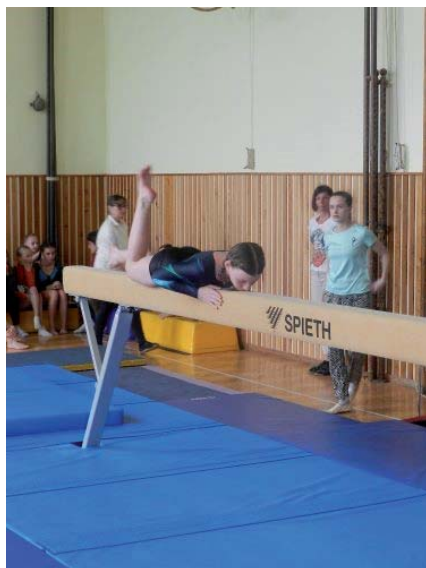
Domácí závody dle ČGF