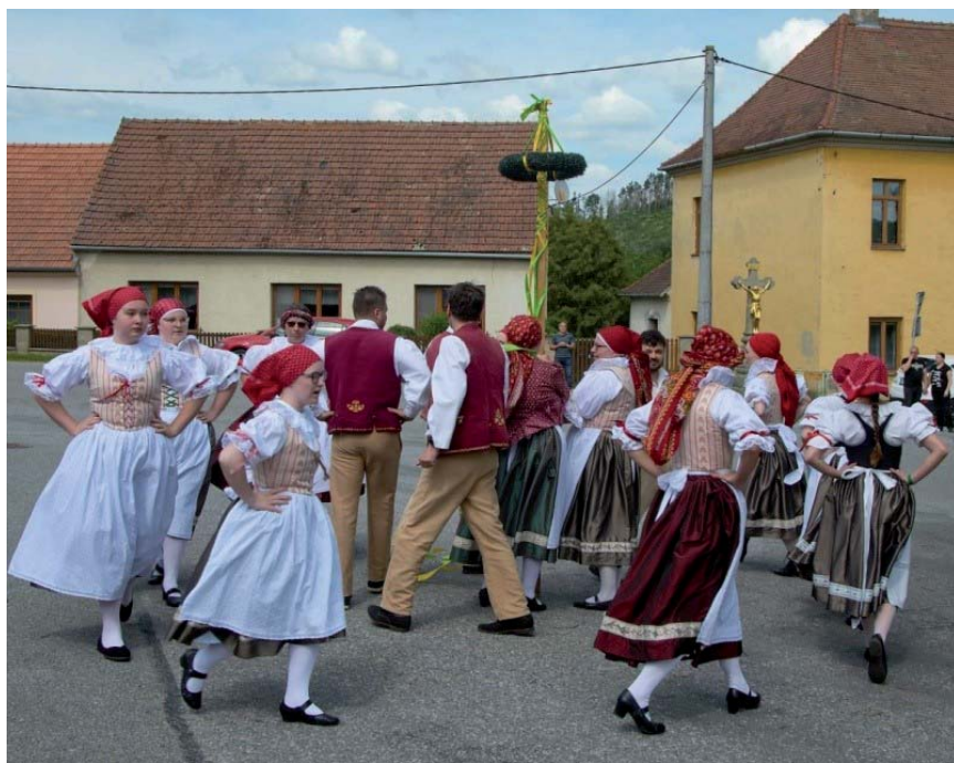
Kácení máje v Přibyslavicích