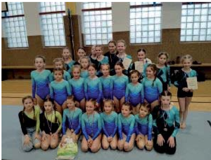
Závody na TJ Sokol Třebíč