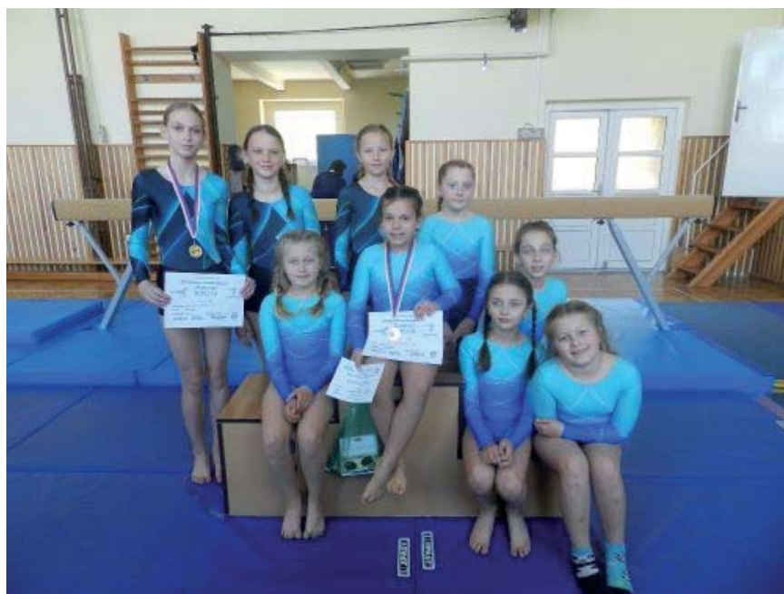
Domácí závody II.