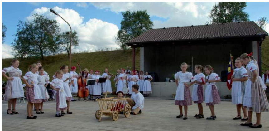
Setkání rodáků Petrovice

Svým vystoupením jsme potěšili účastníky setkání rodáků v Nárámči a v Petrovicích, důchodce v Zašovicích a zpestřili jsme i oslavy 130 let založení hasičského sboru v Heralticích.