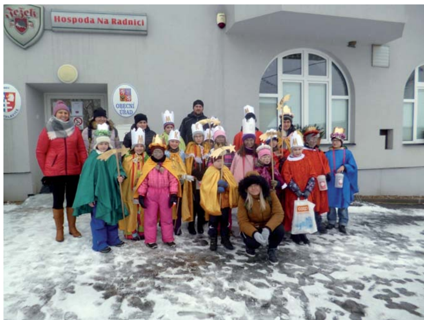
Koledníci Tříkrálové sbírky 2019

Následovala Tříkrálová sbírka v naší obci, které se zúčastnilo celkem 6 skupin malých koledníků za doprovodu dospělých dobrovolníků.