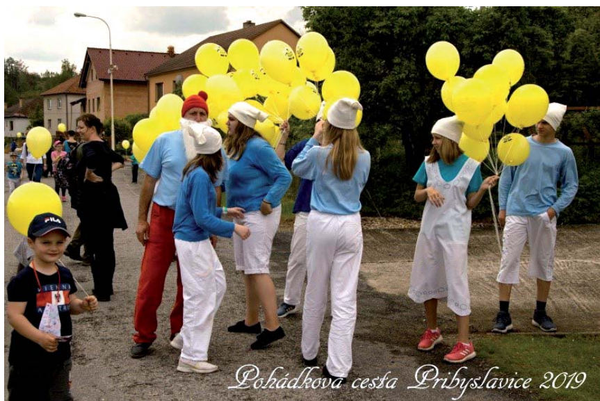
Pohádková cesta Příbyslavice 2019

budou probíhat na hřišti oslavy právě 50 let od založení kopané. Konkrétní program oslav bude znám později, o čemž Vás budeme určitě informovat.